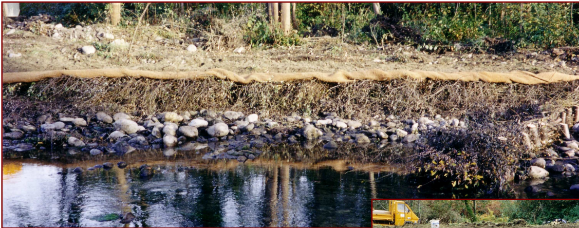
Tressage et branchages anti-sape

Elles opposent une résistance souple aux forces du courant, permettant de mieux dissiper l'énergie. Elles favorisent l'auto épuration du cours d'eau.