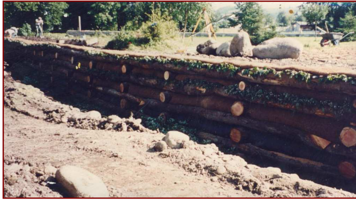
Mise en place de caisson végétal